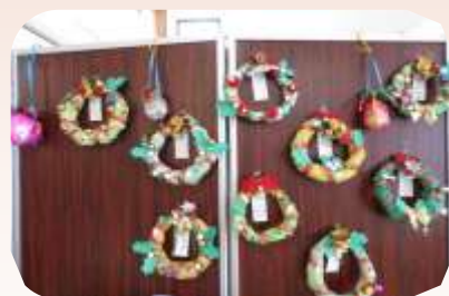
↑完成した作品です！