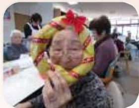
↑もう少しで完成するよ