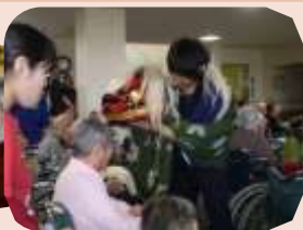
↑健康に嘔んであたまを ↓楽しんでお花

開設記念日に「ひのき屋」の出演を依頼し昼食は寿司店の来訪を受け大好きな生寿司で祝いました。今年も函館水産高校ボランティア部の皆さんがフラワーアレンジメントをたくさんプレゼント