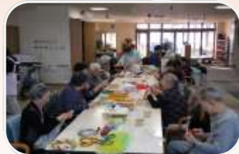
↑みなさん真剣に作ってます

デイサービス11月はクリスマス会に向けてリース作りを行っております。使用する材料は主に新聞紙と針金を使用し、リボンや星などクリスマス用の装飾品をボンドで取り付けて作られています。早くも完成させられる方もおり、とても可愛く仕上がっていました。