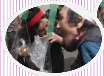
↑ ← 名物パン食い競争

今月は5月23日から27日にかけてよる「巻き て「つれづれ大運動会」を開催いたし ました。