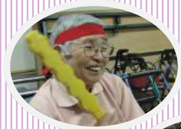
↑ 紅頑張れ！！ 白頑張れ！！→