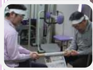
↑ → 急いで巻き取 ります。