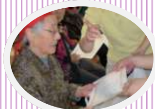
↑ 大変頑張りました！

がでる方もいて、「あれー」「手はタ メー」など熱戦 に応援の声もつ いつい大きくな りました。 皆さんから 「楽しかつ た！」の声があ りました。