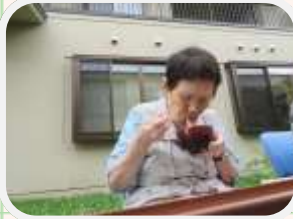
↑真剣に食べてますね!