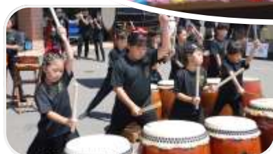
→浜分太鼓、ぼたんサークル大正琴の演奏

お祭り気分を盛り上げてくれたのは浜分太鼓。「ドドン」と周辺いっばいに響きわたりました。大正琴ぼたんサークルは今年初めての参加でしたが、懐かしい曲が会場に流れ口ずさむ姿が見られました。祭りの締めくくりに抽選会があり、手元の番号が呼ばれると大きな歓声が上がっていました。