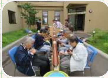
↑流しそうめん全体の様子