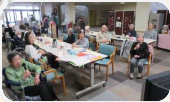
↑みなさん真剣に歌われたり、聴き入られています